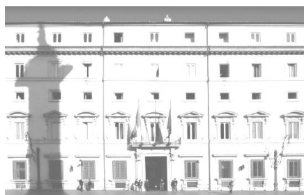
Governo - Ministero della Giustizia

Il Consiglio dei Ministri si è riunito venerdì 21 luglio 2017 ha approvato, in esame definitivo: